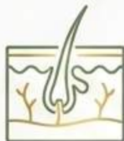
Sebo Humano Natural

Una composición casi idéntica al sebo humano natural.